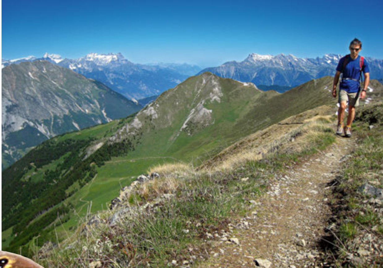
Haut perché sur l'arête menant au Mont Brûlé, on tourne le dos aux Dents du Midi (à g.) et aux Dents de Morcles (à d.). Au centre, le Six Blanc domine l'alpage d'Arpalle.