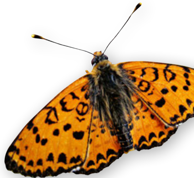
Les prairies de la région regorgent de papillons, à l'image de ce grand nacré ( Speyeria aglaja ) qui butine sur une scabieuse.

sez enclin à s'arrêter régulièrement pour profiter du vaste panorama. Parvenu aux abords du col de Mille, on découvre la cabane du même nom, idéalement située et qui peut faire office de but de randonnée ou de point de départ. Les possibilités de randonnées s'avèrent en effet nombreuses, et le Mont Rogneux tout proche attirera peut-être les amateurs de points de vue encore plus dégagés. Sur le chemin du retour resteront encore les deux jolis alpages d'Erra, avec leurs ruines tapissées de lichens et un