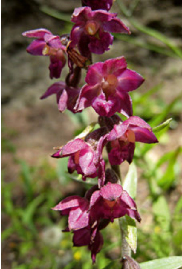
L'épipactis pourpre noirâtre ( Epipactis atrorubens ) ravira celles et ceux qui l'apercevront et se pencheront pour admirer sa corolle.