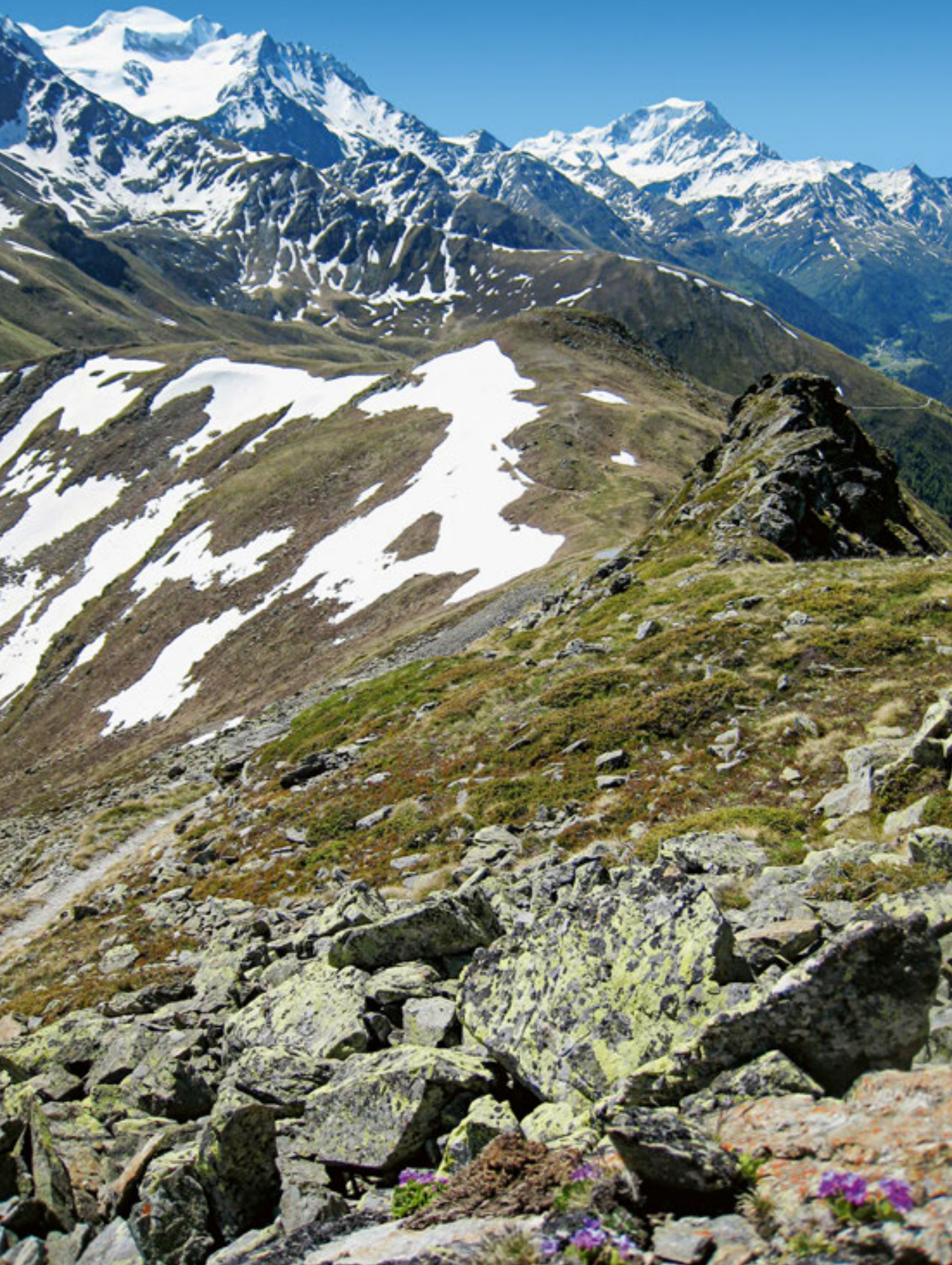
Du Mont Brûlé, l'arête s'abaisse en douceur vers le col de Mille, sous l'œil du Grand Combin (à g.) et du Vêlan.