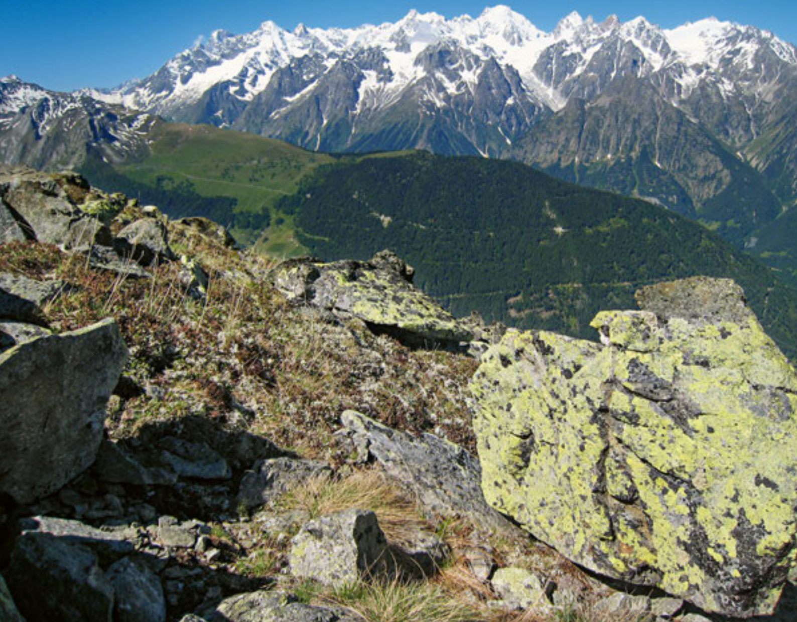
Des Grandes Jorasses (à g.) aux Aiguilles du Tour (à d.), en passant par le Dolent, le Tour Noir, les Aiguilles d'Argentière, du Chardonnet et les Dorées, quel panorama!

rural que connaissent la plupart des villages de montagne. Au contact des anciens et des plus jeunes, on perçoit au travers d'anecdotes une part de l'histoire des lieux. L'école a fermé en 1968 et ainsi contraint les élèves à se rendre à Orsières pour suivre les cours, été comme hiver et à pied, pour 500 mètres de dénivellation. Elle abrite toujours le four banal, remis en service une fois l'an. Les quelques familles qui vivent sur place n'ont guère d'autres choix que de vendre les granges inutilisées du village. Plusieurs ont fait le bonheur d'acquéreurs qui les transforment en résidences secondaires, et deux investisseurs belges y ont développé un complexe misant sur le tourisme durable. Une façon comme une autre d'éviter la disparition du petit coin de paradis que représentent ces constructions.