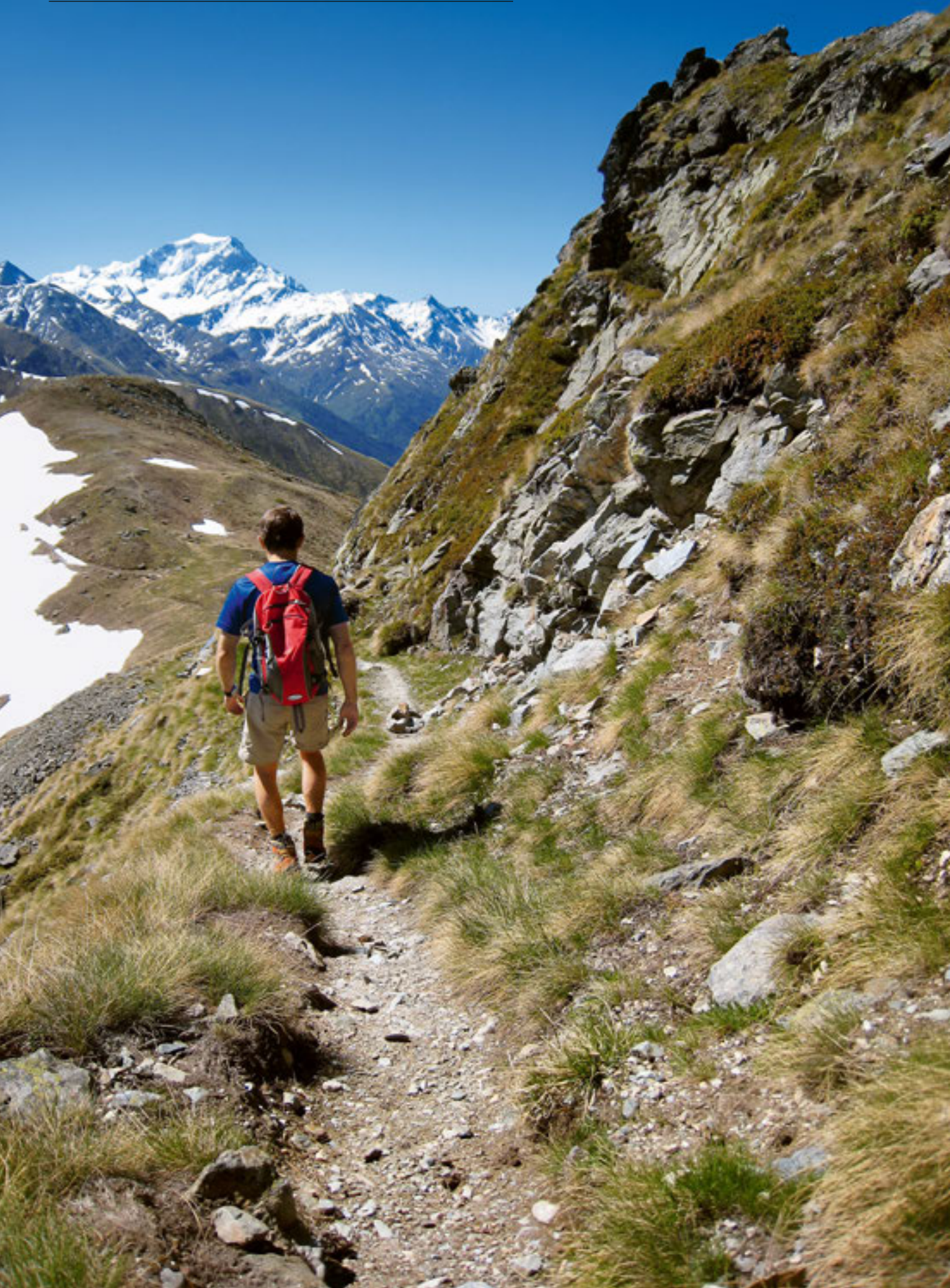
Peu après le Mont Brûlé, on chemine en direction du Mont Vêlan.