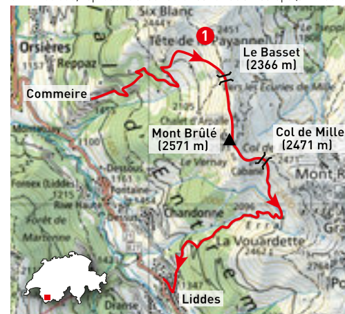
1 Commeire - Mont Brûlé - Liddes

CN 1 : 100 000, reproduite avec l'autorisation de swisstopo (JM120017)