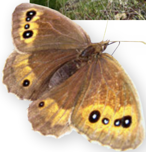
Cette grande coronide ( Satyrus ferula ) femelle apprécie les plants de lavande qui s'épanouissent autour de certains chalets.