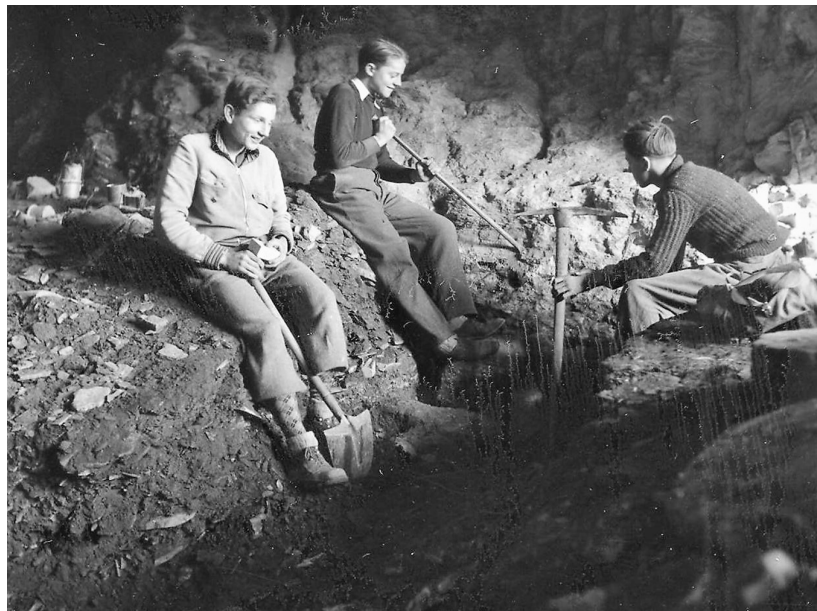
Figure 5 - Les fouilles archéologiques en 1940 (AEV Sion, Fond Ignace Mariétan).

Rapidement après la publication, la valeur scientifique des trouvailles a été mise en doute. M. Jean-Charles de Courten s'engage à faire les démarches nécessaires pour réhabiliter ses travaux auprès du Prévôt Bourgeois (lettre du 11.04.1926