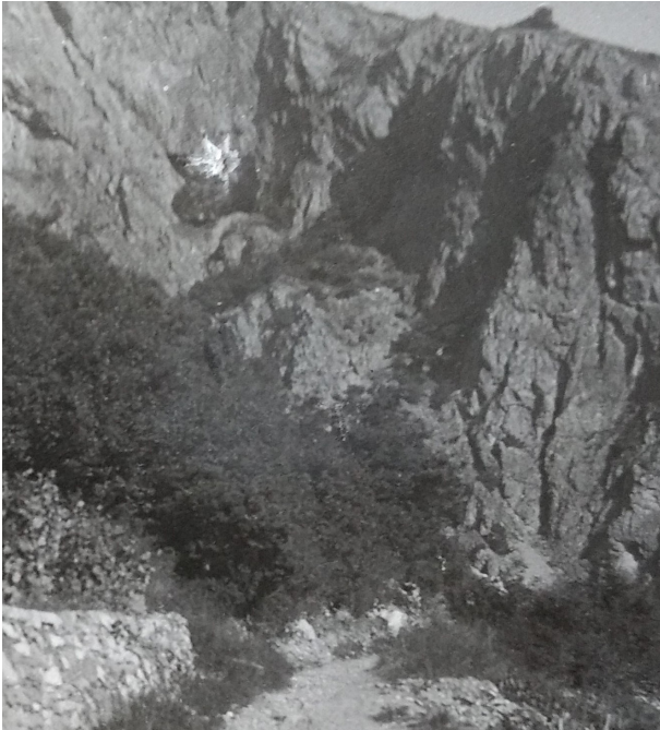
Figure 1 - Le Poteu en 1924.

Gross, personnage atypique s'il en est, possède un savoir encyclopédique; poète et écrivain, il s'intéresse aux domaines les plus divers. En témoigne la liste de ses publications: romans, drames, recueils de poésies, ouvrages d'histoire, etc., soit près de trente titres édités à Sion, Lausanne, Genève, Fribourg, Bulle, Delémont, Paris. En 1936, il reçoit, des mains du Consul général de France à Lausanne, la médaille à l'effigie du Cardinal de Richelieu au titre de «Prix de la langue française pour 1935» (lettre du Consul général du 16.03.1936, AGSB).