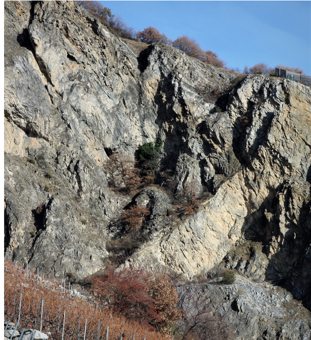
Figure 2 - Le Poteu en 2018.

De 1918 à 1922, il participe à une association de promotion d'une langue universelle (IDO), entretenant une abondante correspondance au plan international (lettre du 26.01.1918 du général Gérard Mathieu Joseph Georges Leman de Liège). Le texte d'une conférence sur «Les systèmes actuels de Langue internationale» est conservé aux AGSB. Il fonde en 1904 «La Croix d'Or», Ligue valaisanne de l'abstinence, qu'il préside jusqu'en 1934; il est secrétaire de la Fédération catholique