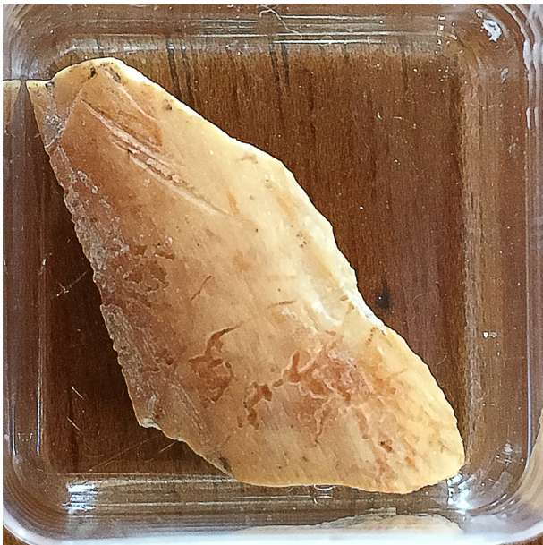
Figure 10 - Fragment d'os présentant des stries de découpes.

Les ossements issus des fouilles anciennes sont inventoriés au Musée d'histoire du Valais à Sion (Inv. No. 40688); il s'agit de 83 fragments et d'une fusaiole extraite d'un fémur de bœuf, analysés en 1984 par l'archéozoologue Hans Rudolf Stampfli. Ce travail d'identification a certainement été effectué en deux