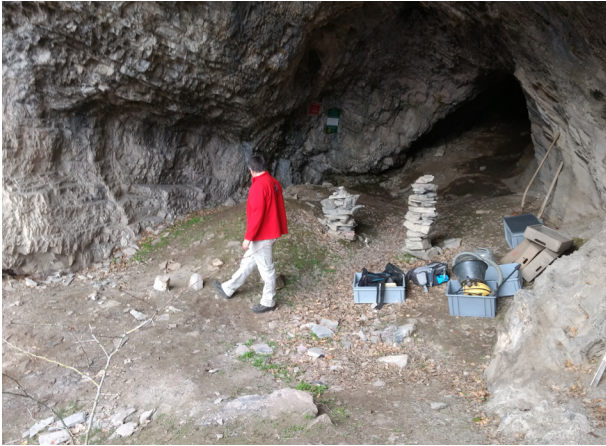
Figure 6 - L'entrée de la grotte. Installation du chantier en 2018 par Urs Leuzinger. Le sol témoigne des traces laissées par les excavations précédentes.